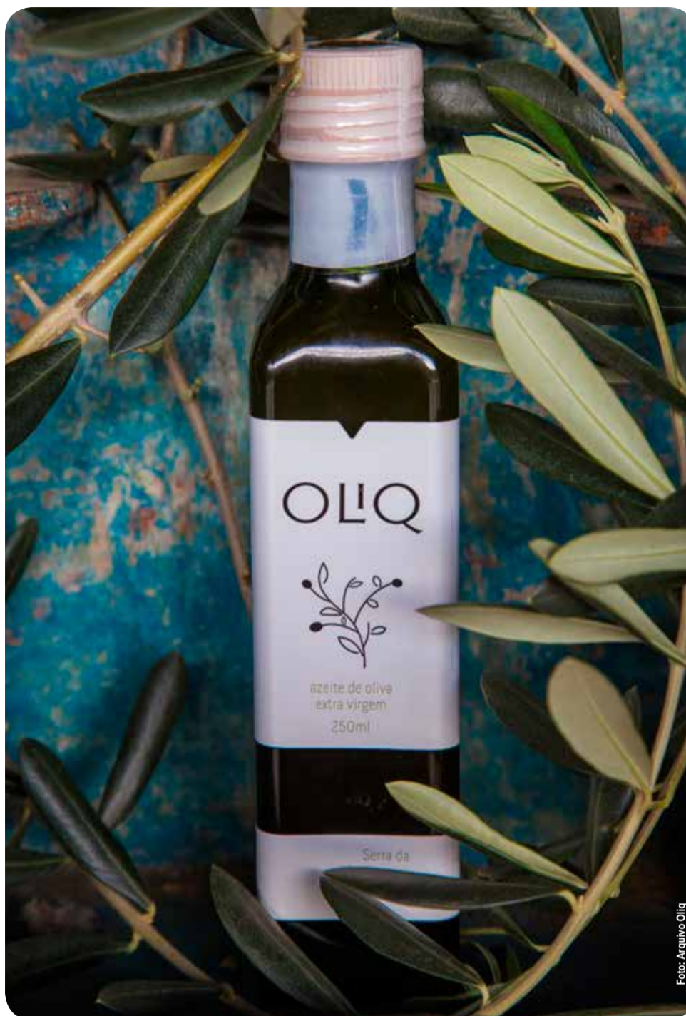
Azeite Oliq é produzido no interior de São Paulo

Foi a vizinhança da cidade com pequenos produtores mineiros