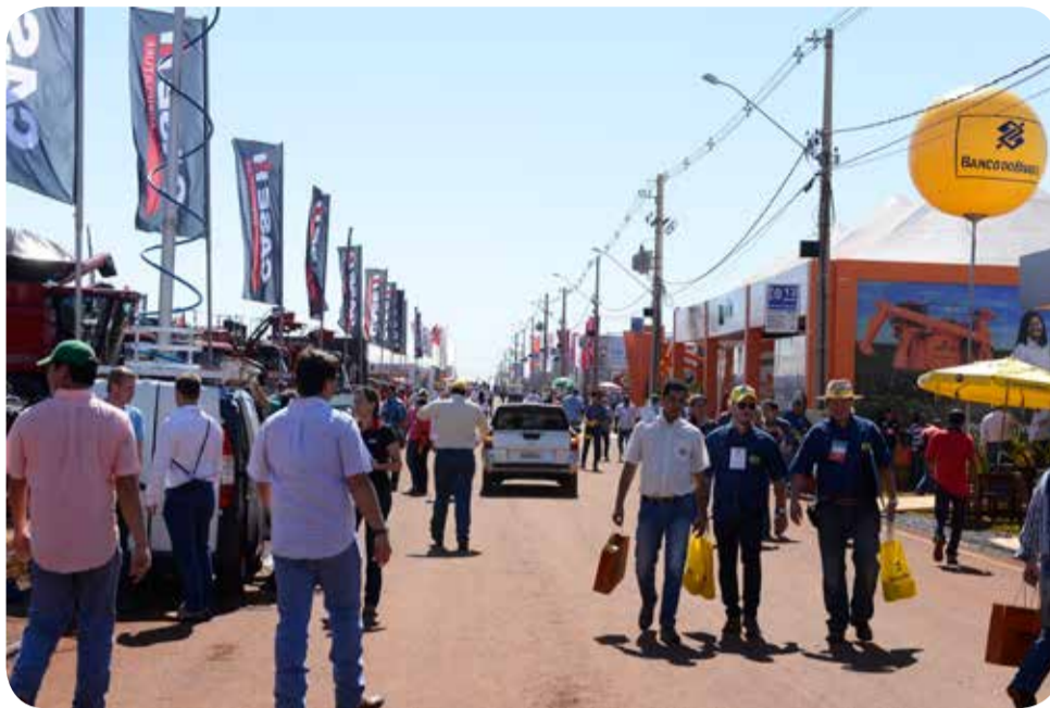
Em 2014, Agrishow reuniu 800 marcas em exposição

A Agrishow está entre as 3 maiores feiras de tecnologia agrícola do mundo, sendo a única do Brasil que conta com a presença de pequenos,