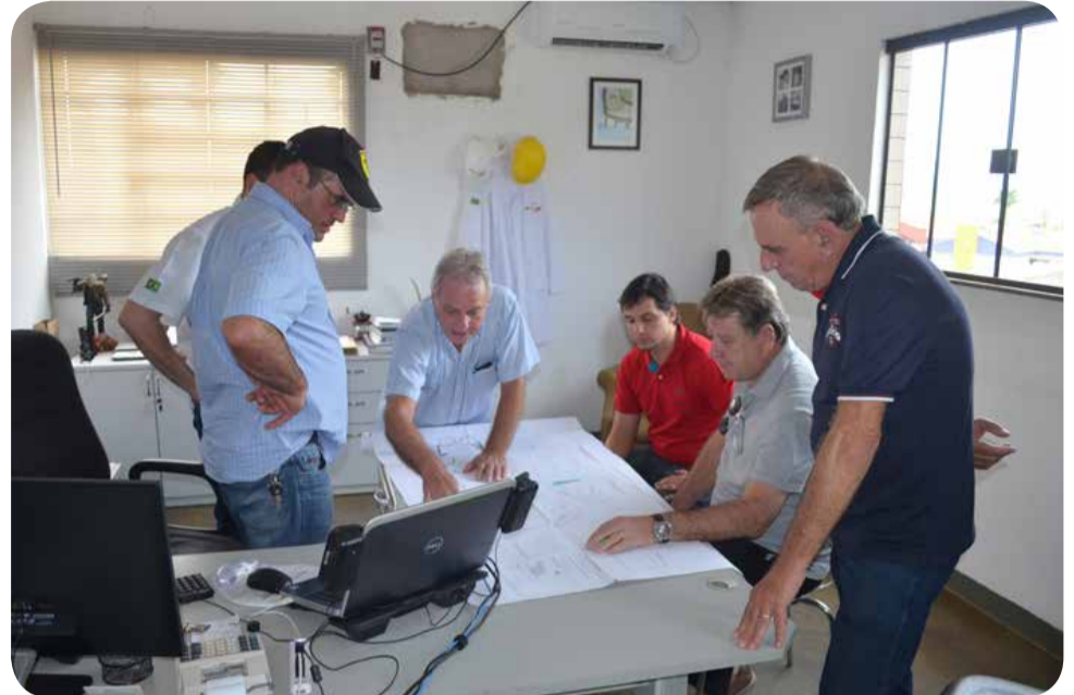
Autoridades conversaram sobre futura unidade em Espírito Santo do Pinhal

O projeto de lei para doação de área já foi enviado a Câmara Municipal para votação. "Será mais uma conquista da Administração, pois além de gerar mais empregos para a população pinhalense, contribuirá com o desenvolvimento econômico do município", ressalta o prefeito. Fundado em 1989, o Frigorífico Cambuí tem conquistado cada