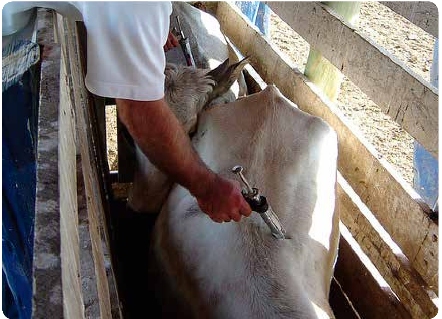
Vacinação é realizada em todo Estado de São Paulo

Os proprietários que não declararam a vacinação estão sendo solicitados para que cumpram o disposto da legislação. O produtor que