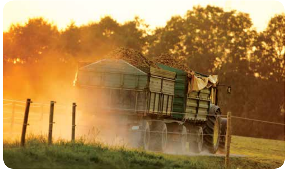
Por meio da entrega da DIPAM, o município pode aumentar a participação na arrecadação de ICMS

Os índices de participação dos municípios no produto de arrecadação são fatores utilizados no repasse do Imposto Sobre a Circulação de Mercadorias e Serviços (ICMS) do Estado. Em razão disso, quanto mais eleva-