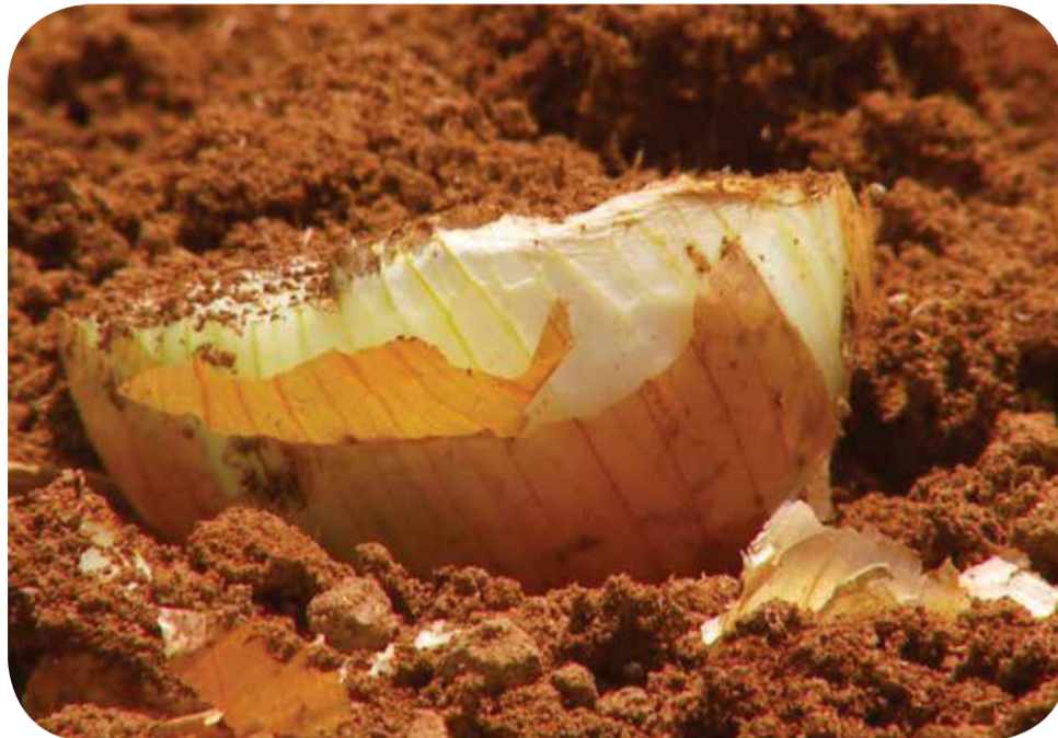
30% da produção de cebola de São José do Rio Pardo será destruída

Ao todo, 30% da produção do município terão o mesmo destino. A previsão inicial era uma safra de 60 mil toneladas, mas só 42 mil foram comercializadas. Por causa do excesso de oferta, o preço caiu e o valor que o produtor recebe pela saca não compensava colher e beneficiar a cebola.