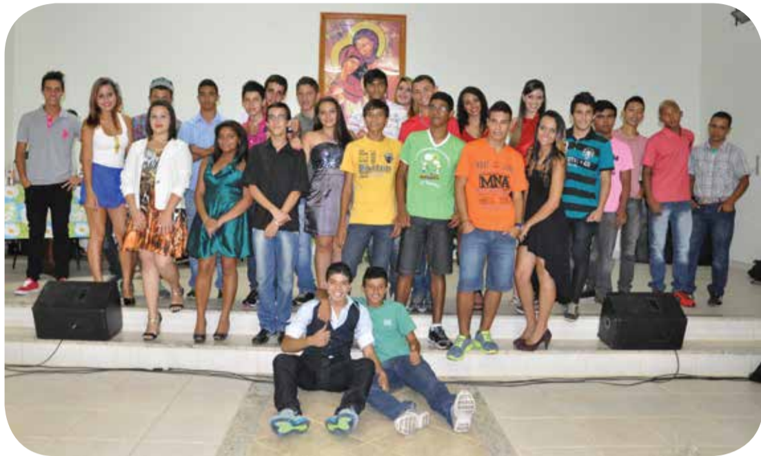
Alunos receberam certificados do Programa Jovem Agricultor do Futuro

Trabalhos de aprendizagem rural e prática de convivências pedagógicas são as principais idealizações do curso