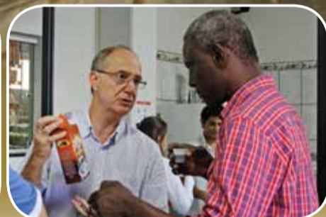
Senegaleses conheceram todos os processos da bataticultura e visitaram empresas locais