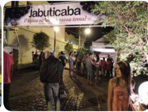
Evento contou com expositores, estandes culinários, artesanato local, praça de alimentação e música ao vivo

Com o objetivo de evidenciar o empreendedorismo voltado para a principal fruta produzida no município, a Prefeitura de Casa Branca (SP) lançou Gourmet Fest Jaboticaba. A cidade é conhecida legalmente como a capital estadual da jaboticaba e por isso nada mais coerente que viabilizar o forne-