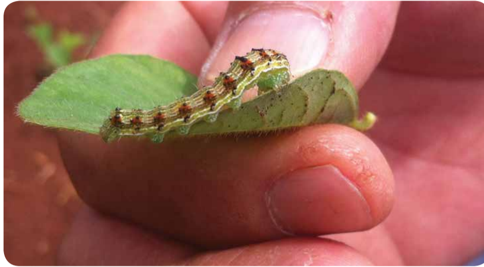
Produtores correm para encontrar maneiras para controlar a helioverpa

Os irmãos Balech têm uma propriedade com cerca de 600 hectares de soja e 400 de milho em Mogi Guaçu (SP). Como a região não é muito tradicional no cultivo de grãos, a incidência da helioverpa ainda é pequena em relação a outros lugares. "Ano passado nós não tivemos problemas com ela. Atualmente, também não estamos tendo, porque nós estamos efetuando o controle da lagarta com um estágio de ínstar