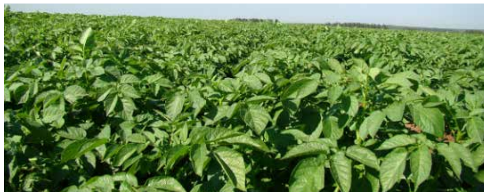
Campo de minitubérculos da variedade Asterix

Alguns cuidados devem ser considerados para que tenhamos uma boa produção do plantio dos mini tubérculos. O solo deve ser preparado para