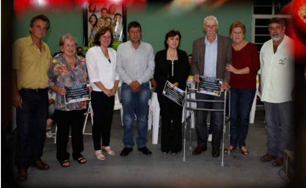
Agricultores que ajudaram na fundação do Sindicato Rural foram homenageados