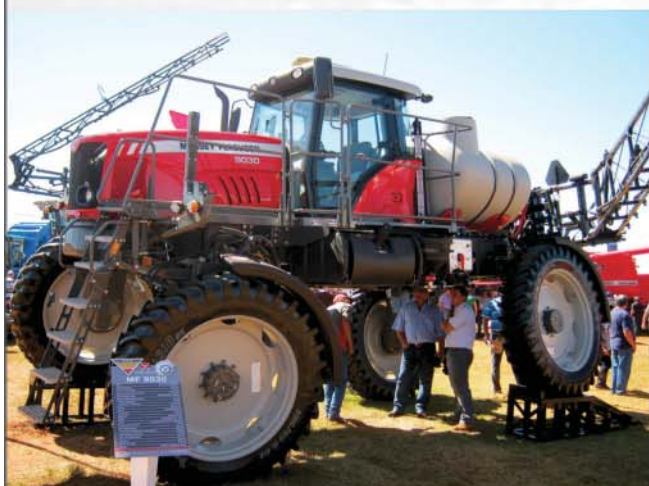
Pulverizador MF9030 grande estabilidade nas irregularidades do terreno