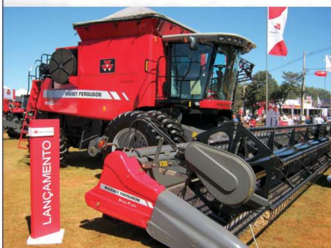
Colheitadeira Axial MF9790 – alto rendimento com custos operacionais mais baixos