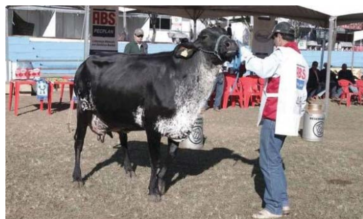
Além de atrair grande público com os show, EAPIC tem como destaque as exposições agropecuárias

vez mais no cenário nacional, ficando conhecida popularmente como a “festa country mais completa do país”.