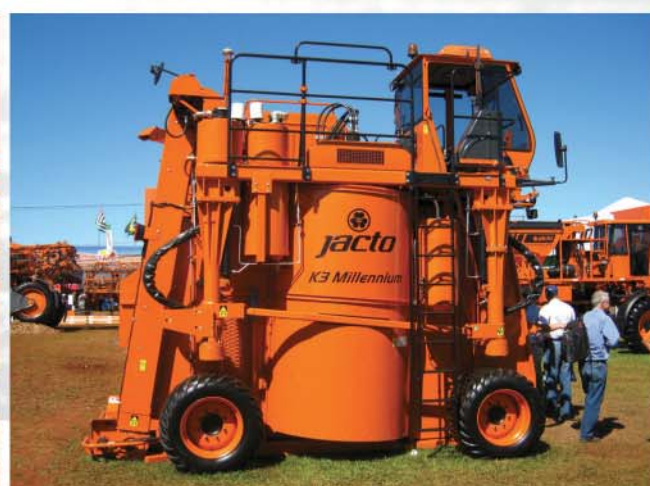
Colhedora de Café Jacto K3 Millennium opção do leque de produtos distribuídos pela Somassey