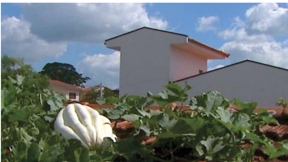
Aposentado conduziu plantação de abóbora para o telhado de sua casa

tem pés de maracujá e uva. A área fértil é pequena, mas graças à criatividade é bem produtiva. Uma parte é para consumo próprio e outra para pássaros, abelhas e outros insetos. "É muito bonito de se ver uma mangava polinizando uma flor de maracujá, uma das flores que eu acho mais bonita", destaca Guimarães. (EPTV)