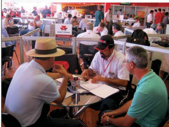
Stand da Somassey – Equipe de Vendas com atendimento diferenciado

Confira algumas imagens captadas durante a 19ª Agrishow: