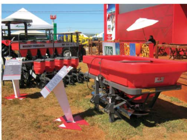
Linha de Implementos Massey Ferguson