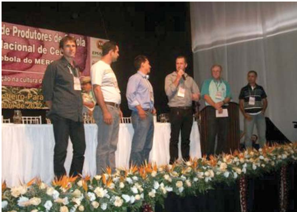
Escolha de São José do Rio Pardo ocorreu durante evento no Paraná

Durante o evento e por ocasião da Assembleia da Associação Nacional de Cebola (ANACE), São José do Rio Pardo foi escolhida para sediar o XXV Seminário Nacional de Cebola e XVI Seminário de Cebola do Mercosul em 2013. "Devido a importância e tradição