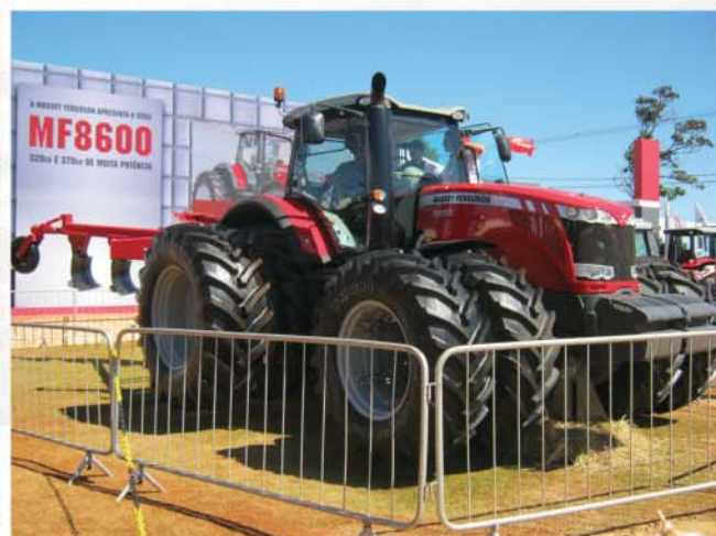
Lançamento: Trator MF8690 370 CV de muita potência