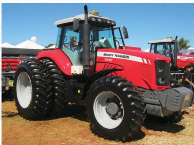
Trator MF7415 Dyna 6 o mais moderno fabricado no Brasil