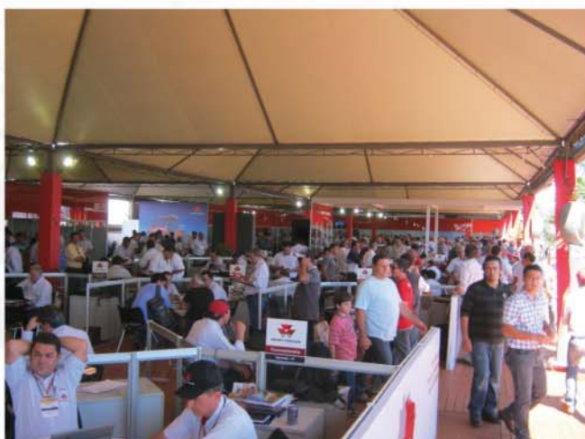
Grande público presente no stand da Massey Ferguson