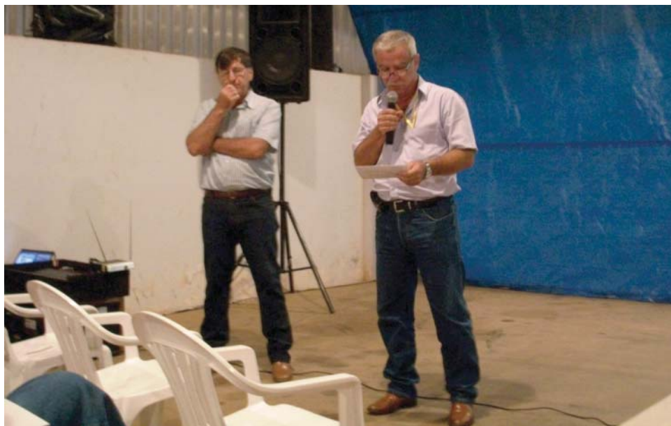
Evento reuniu representantes da cadeia produtiva de café

O curso abordou temas importantes como: agroclimatologia do cafeeiro; interpretação de análise de solo; calagem, gessagem e adubação; certificações e verificações na cadeia produtiva; custo de produção; cafeicultura e economia regional; aspectos práticos da adubação; fisiologia do ca-