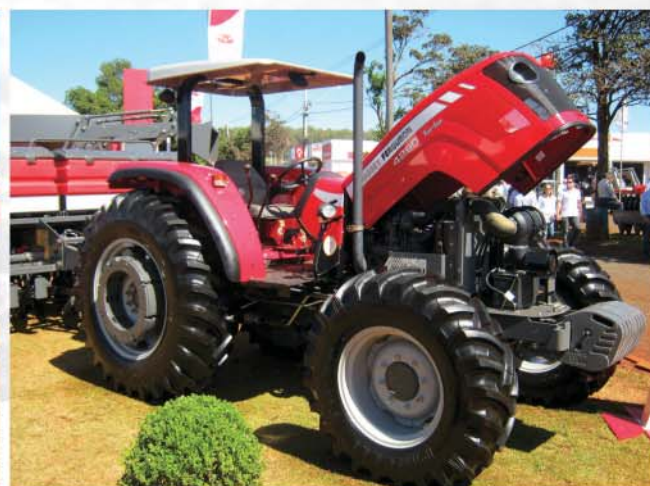
Novo Trator MF4290 agora com 95 CV e motor turbo