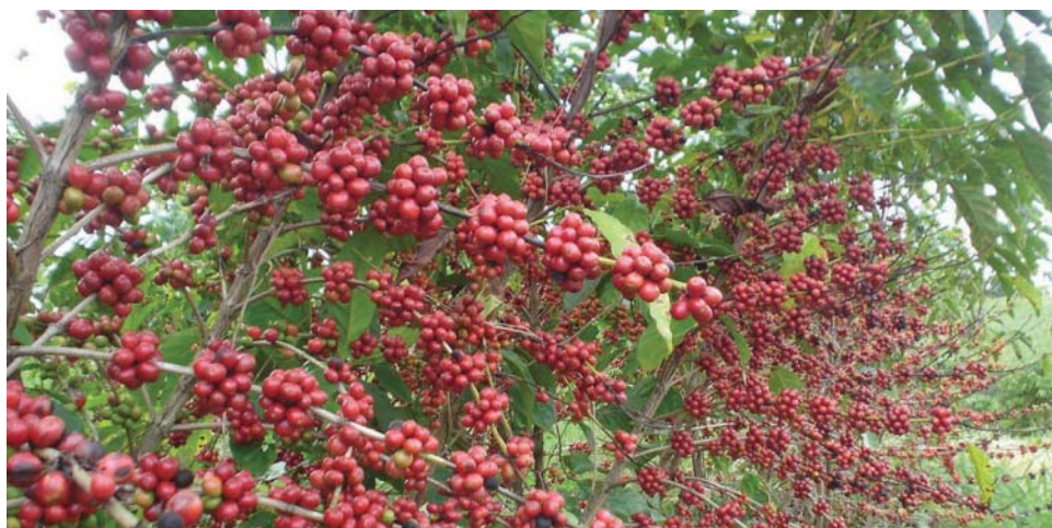
Lotes do café produzido em São Sebastião da Grama foram destaque durante o evento

O pregão realizado entre os dias 1º a 3 de novembro foi aberto a pessoas físicas e jurídicas, que puderam dar seus lances também pela Internet e adquirir apenas uma ou mais sacas de cada lote. O preço mínimo para aquisição dos cafés premiados foi de R$ 814,00 (50% acima da cotação da BM&F/Bovespa do dia 31 de outubro).