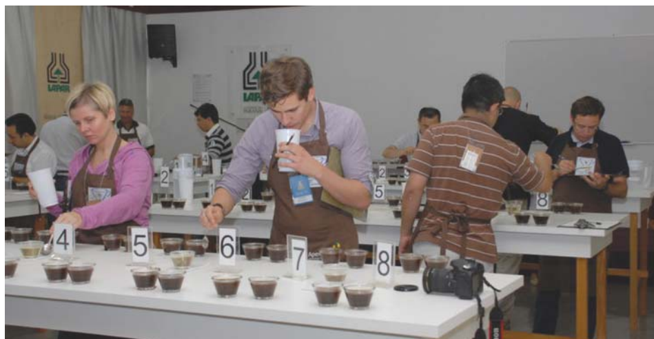
Amostra vencedora recebeu a pontuação 91,41 concedida pelo júri internacional, composto por importadores, torrefadores, baristas e donos de cafeterias