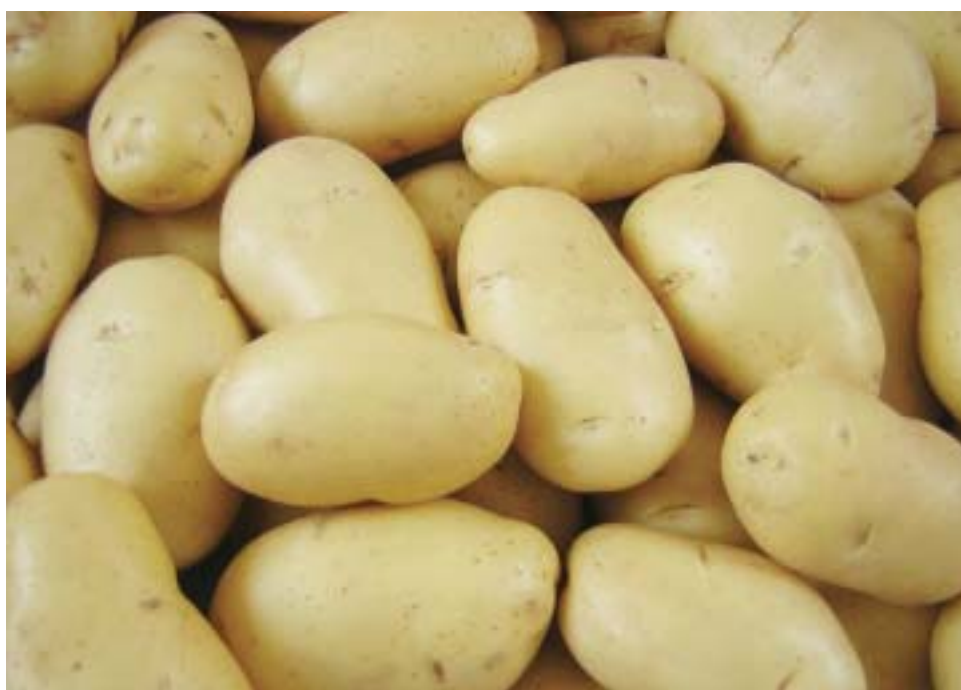
Batata é um dos alimentos mais consumidos no Brasil

Na ocasião, eles destacaram que a produção nacional – mercado fresco, indústria chips e pré-fritas congeladas – depende 100% de variedades desenvolvidas no exterior. Além disso, está cada vez mais difícil a produ-