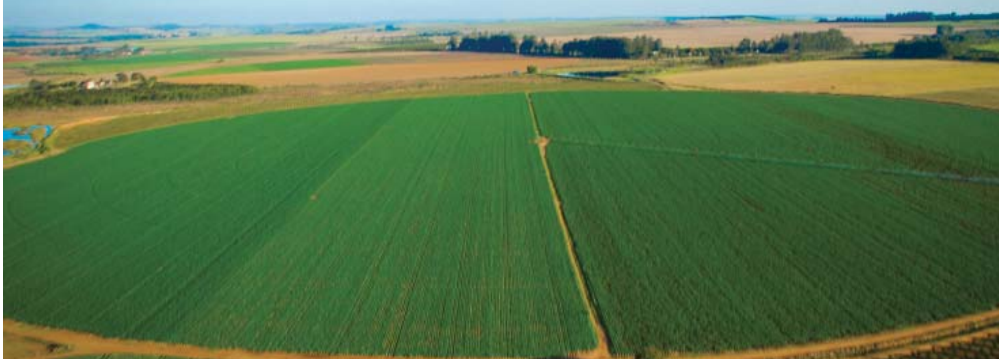
Plantio de batata no país envolve mais de 5 mil produtores

Plantio anual envolve sete Estados, ocupando uma área de 100 mil hectares e gerando milhares de empregos