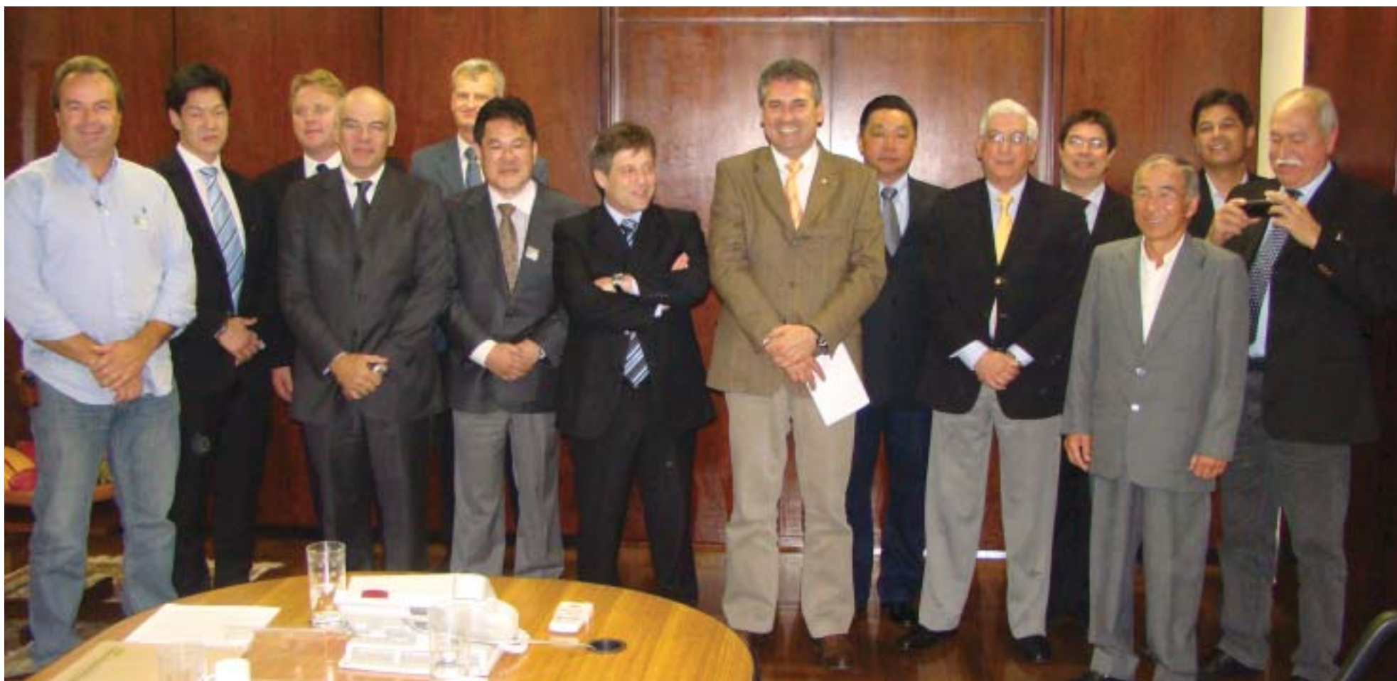
Reunião: integrantes da cadeia produtiva de batata se encontraram com o ministro Mendes Ribeiro Filho para debater mudanças na lei

Problemas na importação batata-semente foram debatidos com ministro Mendes Ribeiro Filho