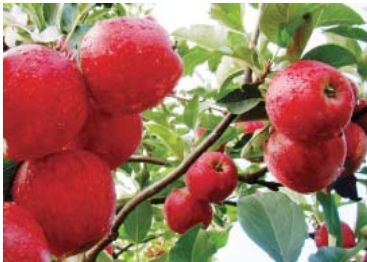
Maçã tratada com nova tecnologia da BASF

A comercialização do Serenade no Brasil é resultado da parceria entre a BASF e a empresa AgraQuest. O acordo prevê licença, fornecimento e distribuição do biofungicida para aplicações foliares e