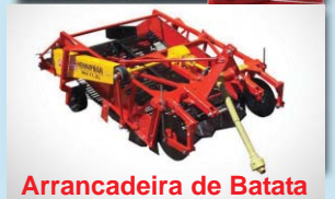
Arrancadeira de Batata