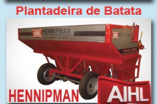
Plantadeira de Batata