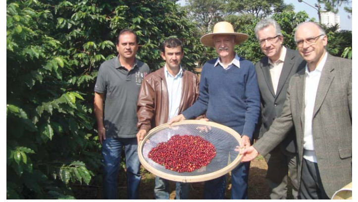
Produtores de São Sebastião da Grama e autoridades durante a colheita no Instituto Biológico

A tradicional colheita no maior cafezal urbano do Estado, do Instituto Biológico da Agência Paulista de Tecnologia dos Agronegócios (IB/Apta), órgão da Secretaria de Agricultura e Abastecimento, aconteceu no último dia 19 de maio. O evento marcou o início simbólico da colheita do produto em São Paulo e contou com a presença do secretário em exercício Antônio Julio Junqueira de Queiroz e de representantes de diversas áreas da cadeia produtiva.