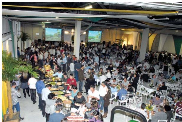
Evento reuniu mais de 670 convidados