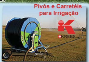
Pivôs e Carretéis para Irrigação

Av. Walter Tatoni, 618 - Vargem Grande do Sul Fone - (19) 3641-2028