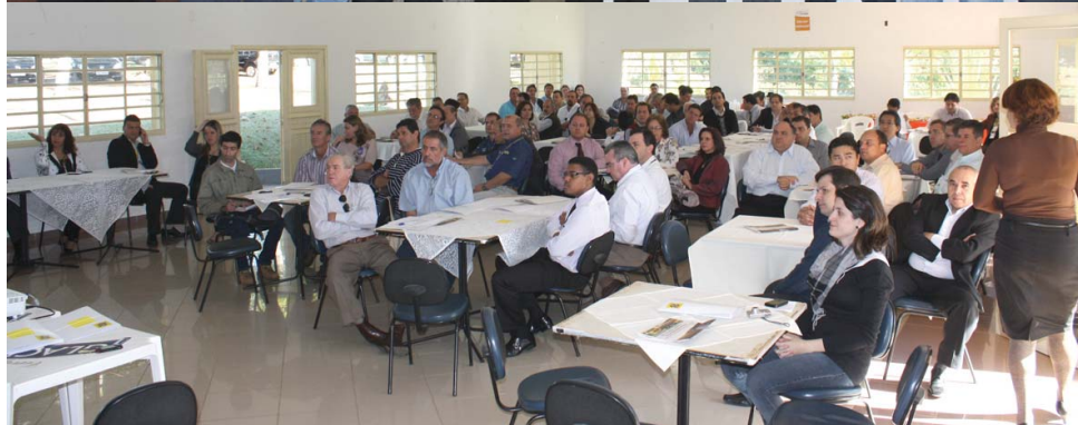
Encontro contou com representantes das agências do Banco do Brasil e do setor agropecuario regional

novo teto de Investimento Agropecuário Tradicional de R$ 300 mil. Este pode ser elevado em até R$ 750 mil (quando os R$ 450 mil adicionais se destinarem à aquisição de reprodutores e matrizes bovinas e bubalinas) ou em até R$ 1 milhão (quando os R$ 700 mil adicionais forem para a fundação, ampliação ou renovação de lavouras de cana-de-açúcar). Além disso, houve ainda a elevação de teto Pronamp Investimento para R$ 300 mil.