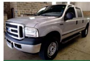
F 250 XLT MAXX POWER 2009

www.comercialgomes.com comercialgomes.cb@bol.com.br