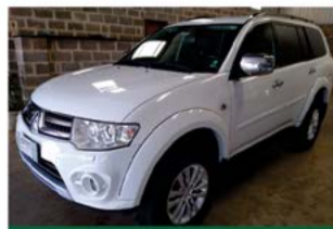
PAJERO DAKAR V6 FLEX AUTO 2015