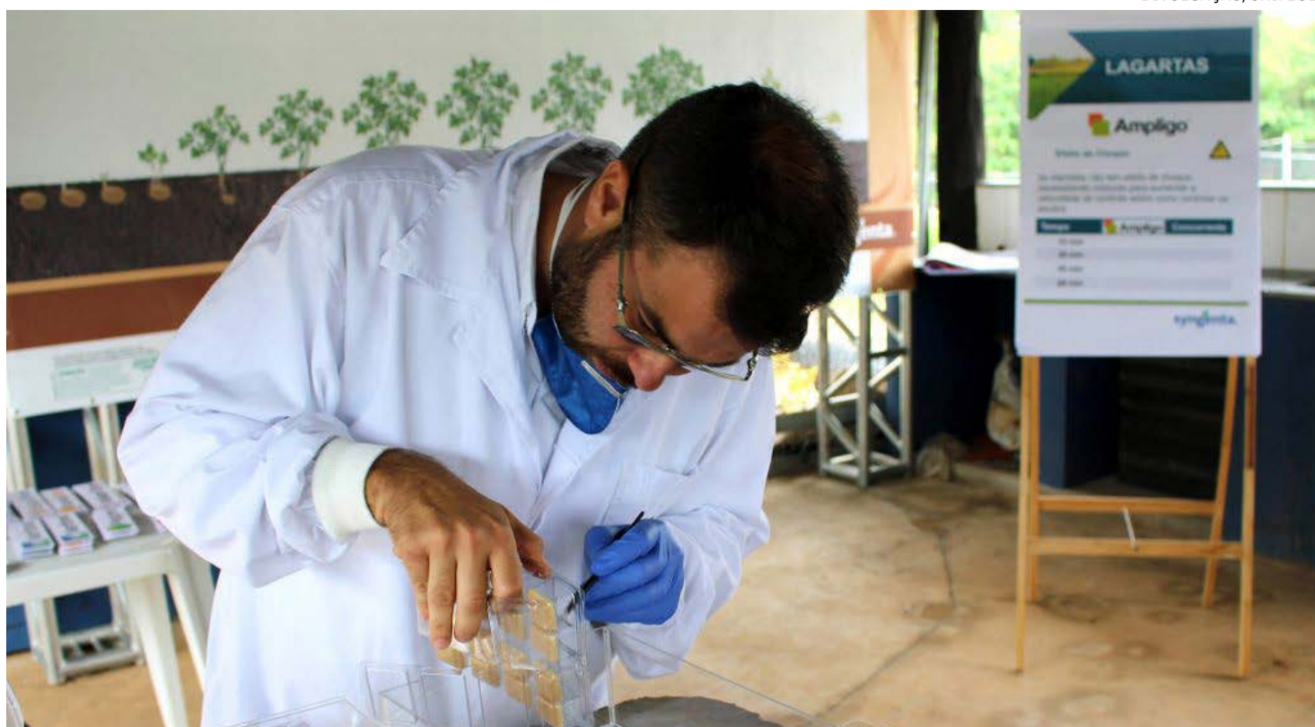
Estação Conhecimento: capacitação foi focada nas culturas de batata e tomate

Outros benefícios são as pesquisas e projetos que ligam os futuros engenheiros à parte operacional da agricultura. "Mais do que isso, há o net-