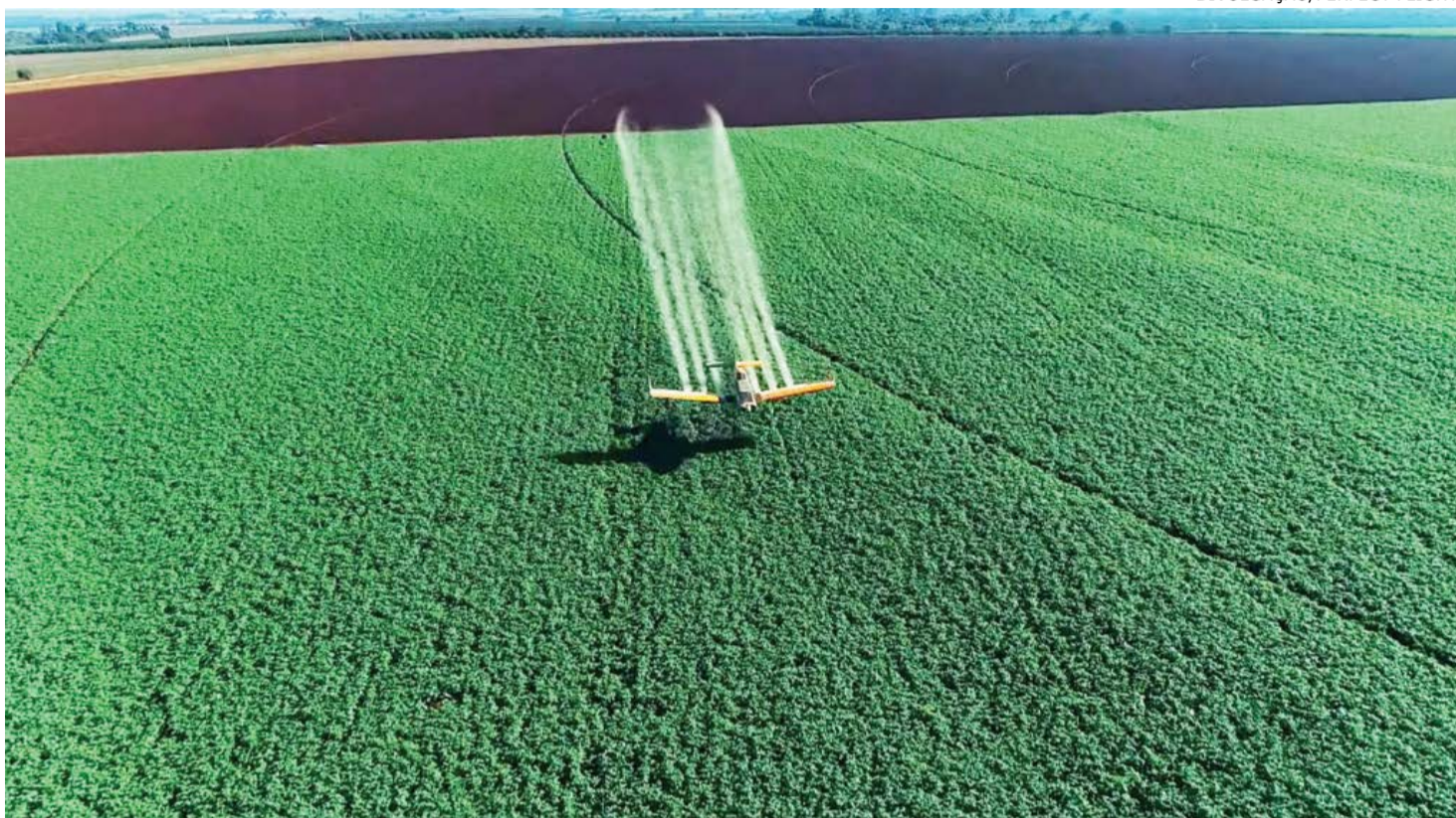
Perfect Flight: projeto de monitoramento e gestão de pulverização aérea é o maior até então implantado no mundo

Perfect Flight, é possível estabelecer melhores índices de assertividade na aplicação de defensivos agrícolas, por meio de dados que ajudam a preservar recursos naturais e a evitar desperdícios de produtos e o excesso no uso de defensivos.