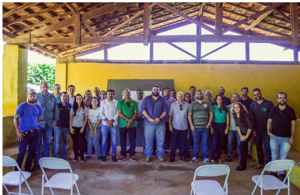
Autoridades, participantes e convidados durante o lançamento do projeto na Fazenda São Vicente

A Prefeitura de Águas da Prata está participando da implantação de uma nova iniciativa voltada para conservação das nascentes. Trata-se do Projeto Conservador Rainha da Águas, lançado no dia 14 de fevereiro na Fazenda São Vicente.