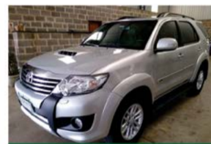
HILUX SRV AUTO 2013