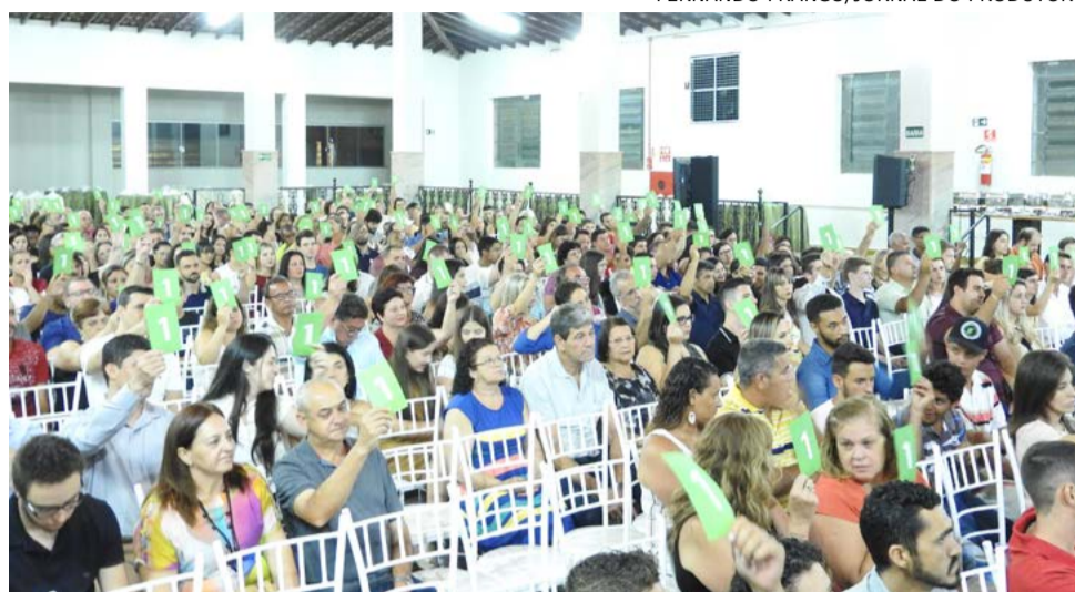
Encontro reuniu mais de 400 cooperados na SBB

A Sicredi União PR/SP promoveu no dia 5 de fevereiro a sua assembleia de prestação de contas em Vargem Grande do Sul. O evento foi realizado na Sociedade Beneficente Brasileira (SBB) e contou com a participação de aproximadamente 400 cooperados.