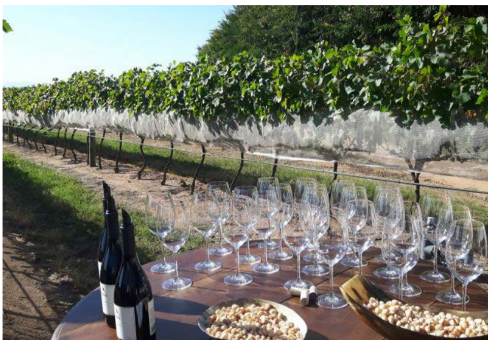
Espírito Santo do Pinhal tem atraído os amantes do vinho de qualidade