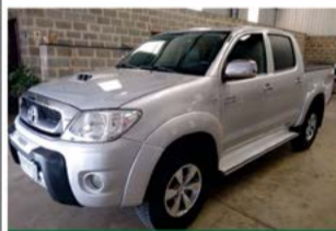
HILUX SRV AUTO 2010