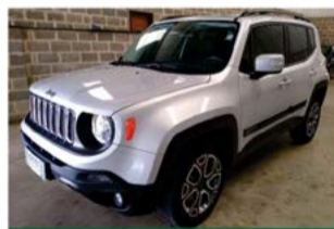
JEEP RENEGADE LONGITUDE AUTO 2018