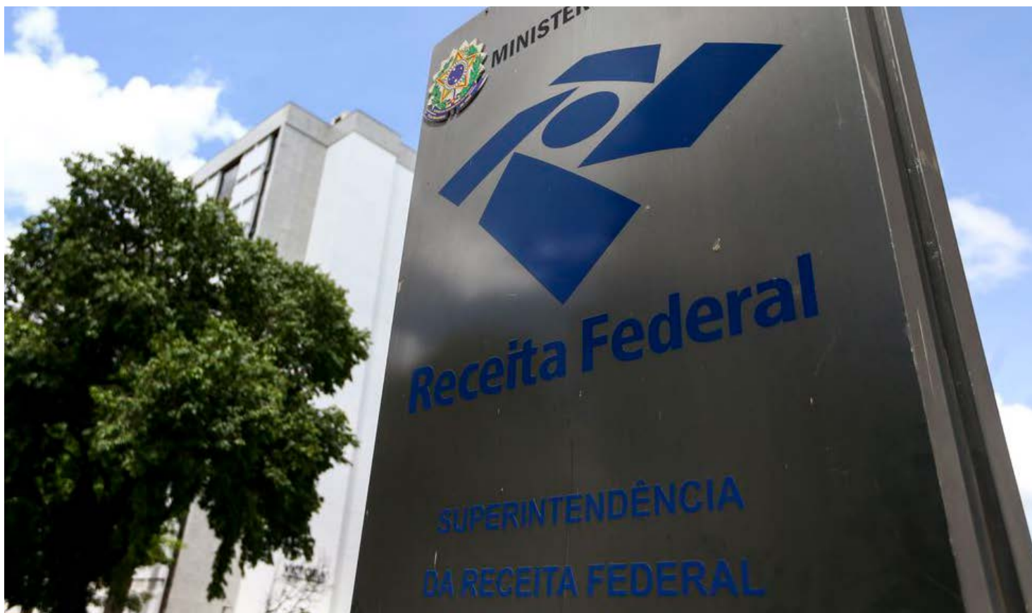
Receita Federal já está recebendo as declarações do IRPF 2020

O resultado da exploração da atividade rural exercida pelas pessoas físicas é apurado mediante escrituração do livro caixa, abrangendo as receitas, as despesas de custeio, os investimentos e demais valores que integram a atividade. Diante disso, o contribuinte deve comprovar a veracidade das receitas e despesas escrituradas,