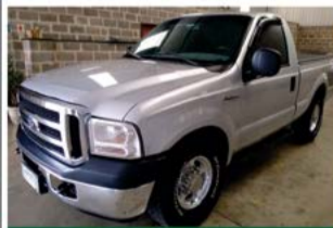
F 250 XLT C.SIMPLES 2001