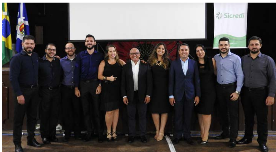
Equipe Sicredi PR/SP organizou a assembleia em Vargem