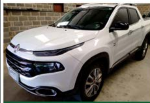
FIAT TORO VOLCANO AUTO 2019