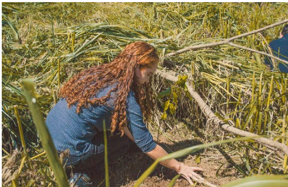
Preservação das nascentes: Iniciativa contará com o plantio de mudas

Ação é desenvolvida pela ong internacional The Nature Conservancy em parceria com a administração municipal