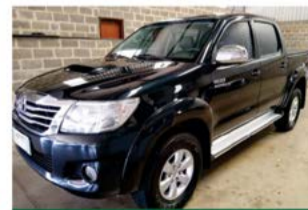
HILUX SRV AUTO 2013