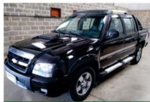
A 10 EXECUTIVA COMP 2010