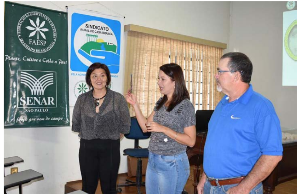
Curso é uma iniciativa da prefeitura em parceria com o SENAR e o Sindicato Rural

Por meio de uma parceria com o Serviço Nacional de Aprendizagem Rural (SENAR) e o Sindicato Rural, a Prefeitura de Casa Branca iniciou a nova turma do curso de Turismo Rural. A atividade teve início no dia 9 de março e conta com a participação de aproximadamente 15 participantes, dentre produtores rurais e interessados. O curso tem o objetivo de capacitar os alunos para trabalharem com turismo agrário, de forma a