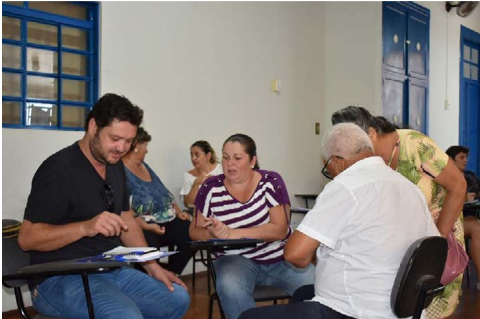
Alunos serão capacitados para trabalharem potencial turístico das propriedades rurais