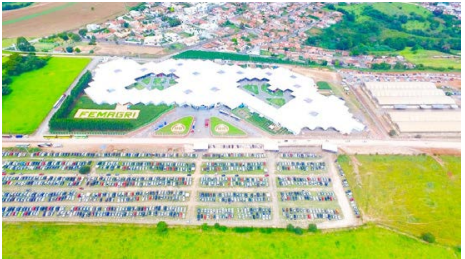
Feira reúne 130 expositores, número 8% maior em relação à edição anterior