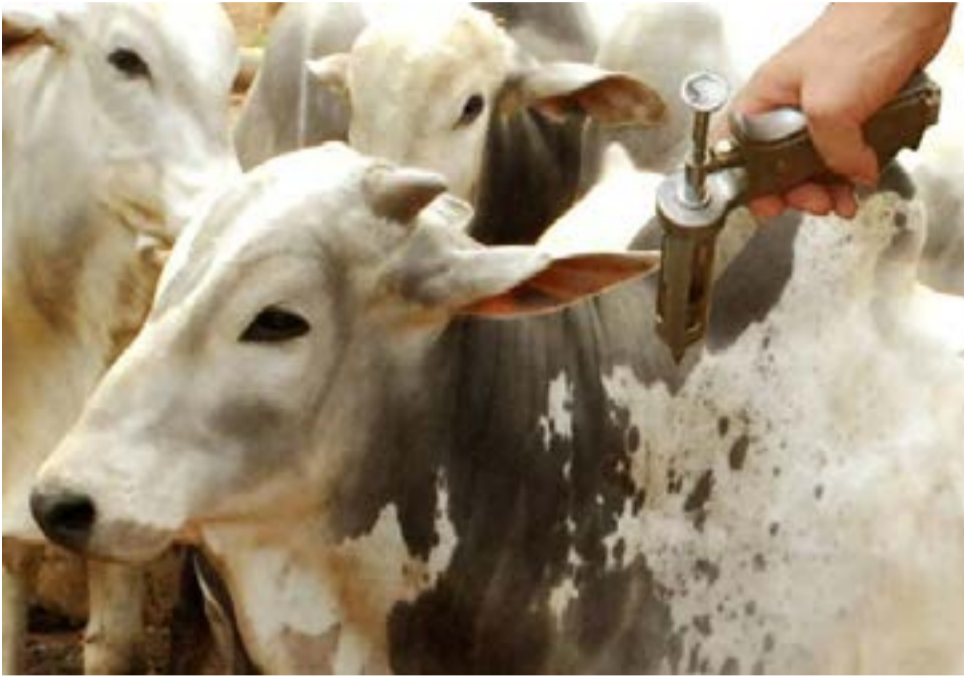
Vacinação foi obrigatória para todos os bovídeos, independente da idade

Durante a etapa foram vacinados 11.072.122 bovídeos, segundo dados da Secretaria de Agricultura e Abastecimento