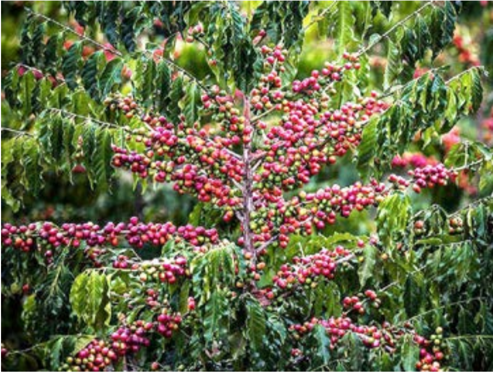
Café é a principal cultura do município