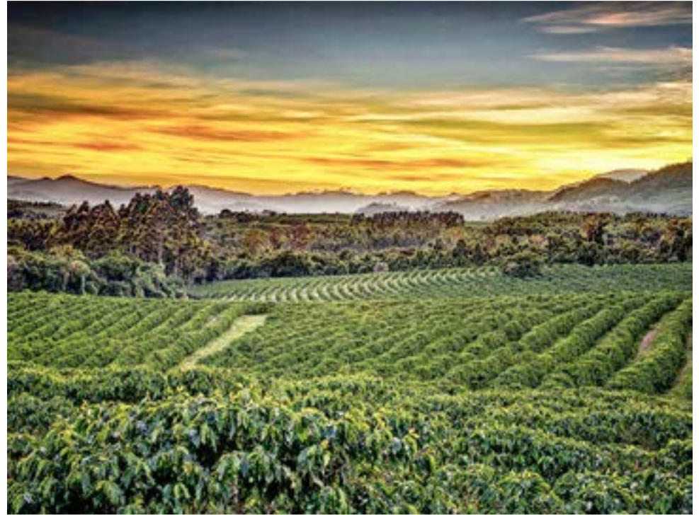
Pinhal conquistou um dos primeiros títulos de MIT

Leonardo Costa Com 43 mil habitantes e a 200 quilômetros da capital, o município de Espírito Santo do Pinhal é uma nova referência do turismo paulista. Circundado por belas paisagens e por águas minerais de qualidade, a cidade tem a produção de café e vinho como produtos de grande importância para a economia local. E foi assim que Espírito Santo do Pinhal conquistou um dos primeiros títulos de MIT (Município de Interesse Turístico).