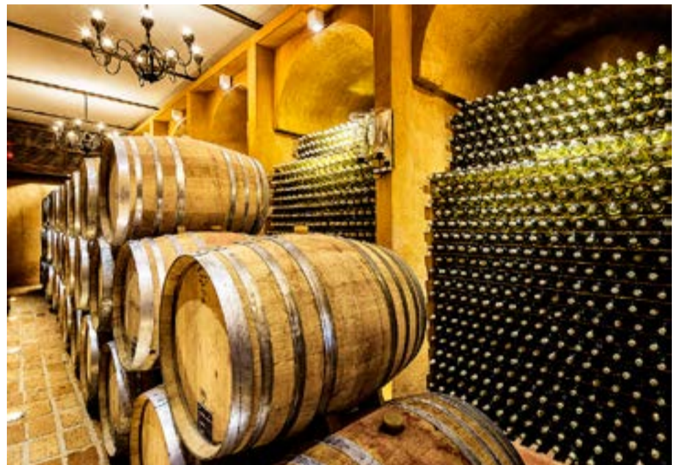
Cidade é conhecida por produzir um dos melhores vinhos do Brasil

é visível na cultura da cidade, e desde então os produtores aprimoraram seus produtos, e hoje se destacam pela produção de cafés finos, exportado para o mundo, além de possuir a completa cadeia agroprodutiva do café - passando por processo de pesquisa do genoma da semente até a finalização do sabor do café na xícara. Outro produto que vem com a marca Espírito Santo do Pinhal é o vinho e atualmente a cidade vem sendo reconhecida por produzir um dos melhores vinhos do Brasil, ganhando prêmios significativos no exterior pela qualidade e excelência no processo de produção. Com atrativos como o Núcleo Histórico Tombado, Lago Municipal, Fazendas de Café, Theatro Avenida, Igreja Matriz e a Vinícola