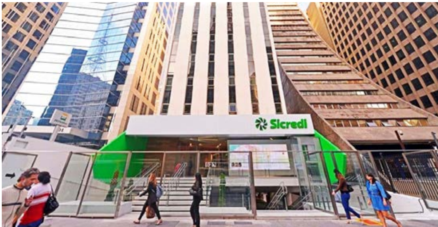
Sicredi está entre as maiores instituições financeiras do Brasil

Vale destacar que, em 2017, o Sicredi marcou presença em diversos rankings e premiações nacionais, entre as maiores instituições financeiras do País, tais como Top 5 (Banco