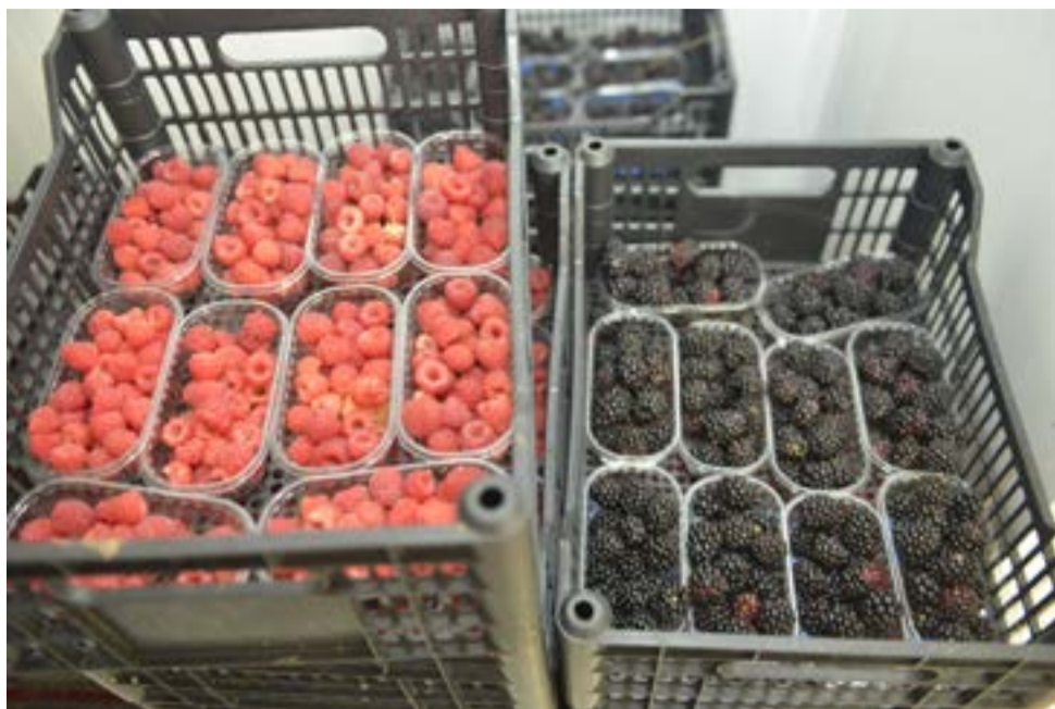
Variedades cultivadas têm conquistado o mercado

Propriedade possui cerca de 15 mil pés de amoras e 20 mil pés de framboesa