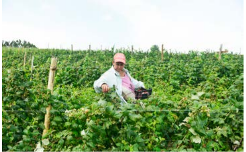
A colheita é toda manual e os frutos já são colocados nas cumbucas em que serão comercializados in natura

As frutas do grupo das berries são culturas bastantes rústicas do ponto de vista fitossanitário. "Isso nos permite produzir utilizando o mínimo possível de produtos fitossanitários. A maioria dos problemas com patógenos e insetos são controlados com o uso de manejo cultural, como ponto certo de