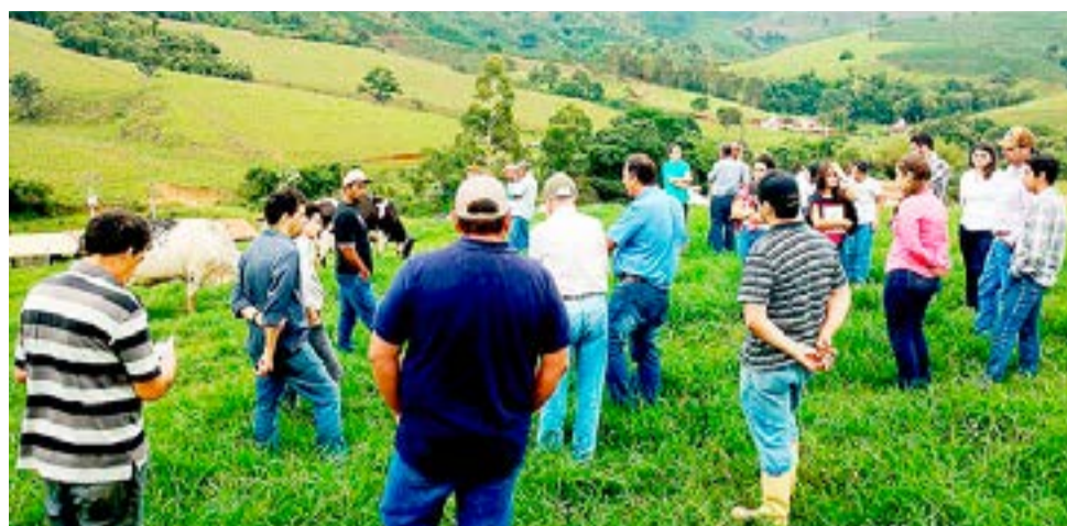
Produtores da região participaram do evento promovido pela CATI em parceria com o Sindicato Rural de Caconde

Dividido em partes, o Dia de Campo contou com a "Manhã do Leite", com apresentação de palestra proferida pelo engenheiro